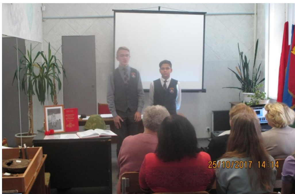
Ученики школы №45 читают матерям стихи