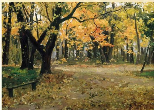
Остроухов И. С. Осень в Абрамцевском парке