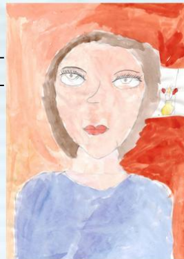
Рисунок Рябинкиной Екатерины